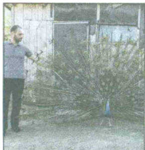
Šepure se i paunovi