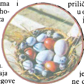
Puna košara prirodno bojenih jaja

Saranje odnosno bojenje vaskršnjih jaja prirodnim ili vještačkim bojama i razne tehnike njihovog ukrašavanja za Mladena Goronjića, uzgajivača sitnih životinja iz Čirkin Polja kod Prijedora, nepoznanice su. Umjesto njega, jaja same „boje“ njegove koke, koje ovaj Prijedorčanin uzgaja skoro dvadesetak godina.