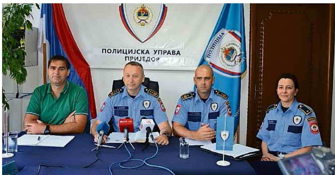
Dalibor Ivanić, načelnik Policijske uprave Prijedor (drugi slijeva)