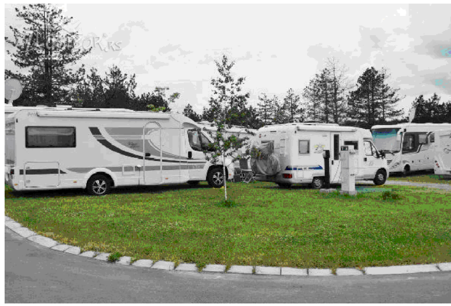
7 kamp parcele -kamperi-PRIMJER