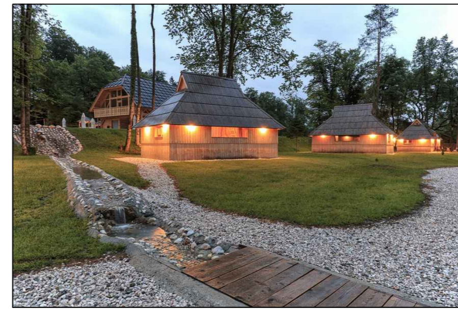
5 smještajni objekti -drvene kuće -PRIMJER