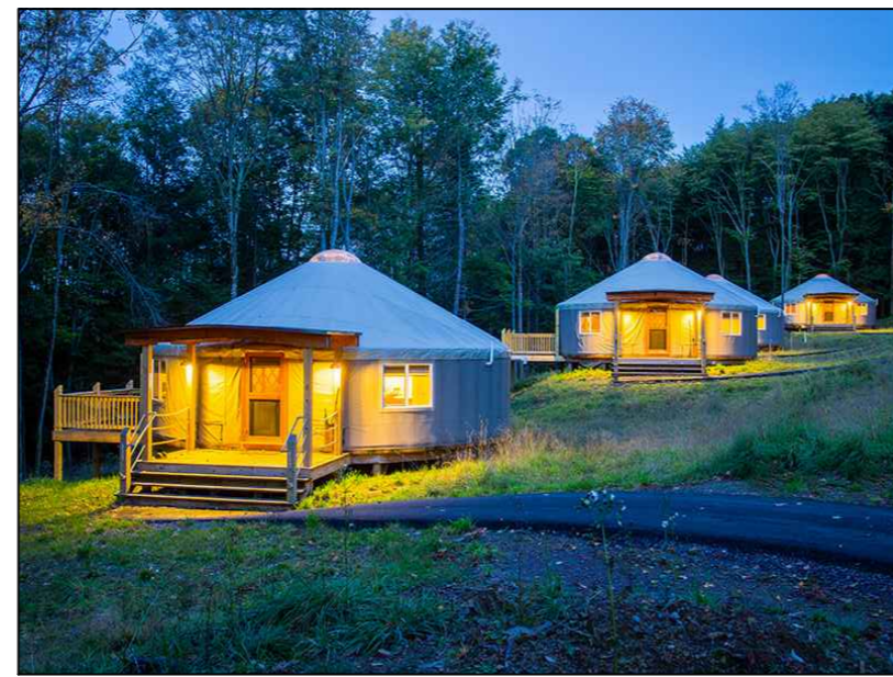
5 smještajni objekti -ŠATORI PRIMJER